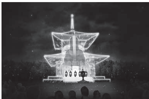
3D プロジェクションマッピング

御開帳以外にも、霊宝館で高野山が誇る宝物を公開する大法会期間限定の特別展が行われます。また、南こうせつ氏のコンサートや壇上伽藍を舞台とした3Dプロジェクションマッピングも開催され、千二百年の記念の年を彩ります。地域の皆様にも是非、この機会に法会や催事に参加して頂いて、高野山の類い希な歴史や文化に改めて触れて頂きたいと思えます。