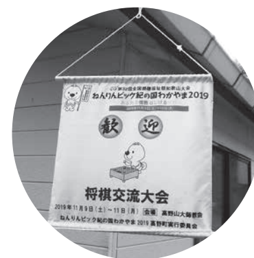
【タペストリー掲示の例】