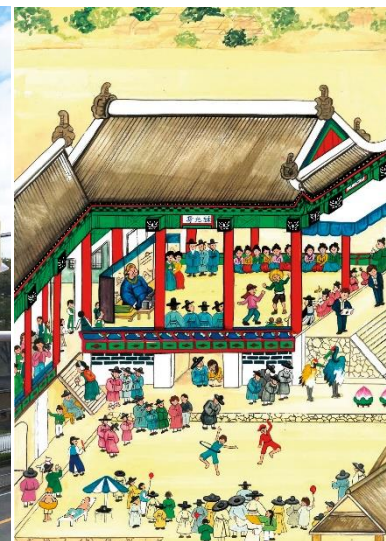
近畿大学文芸学部学生の作品(左)、Tシャツプリント作品(中)、東國大学美術学科学生の作品(右)