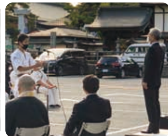
高野山高校空手部の決意表明

☎ 高野幹部交番 ☎ 0736-56-2436 ☎ 高野町教育委員会 ☎ 0736-56-3050