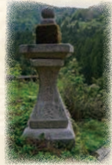
▲弁財天社の石灯籠

村の氏神なり」と記され、今も観音堂のすぐ後ろ側にあります。弁財天社の石灯籠には「安永二年」(1773)と刻まれています。