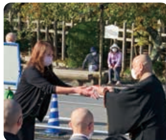
任職会からタスキの贈呈の様子