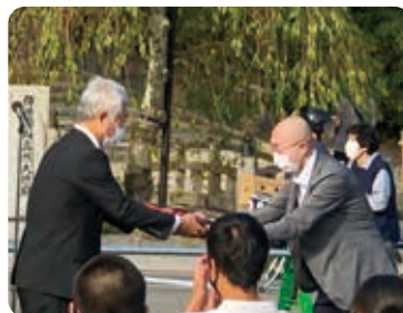
和歌山県警よりベストの贈呈の様子(高野山大学へ)