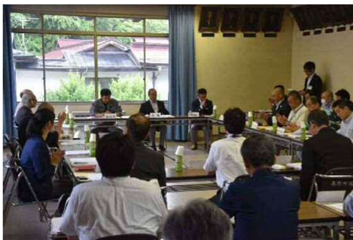
第1回高野町歴史まちづくり協議会の様子