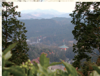
弁天岳から根本大塔を望む