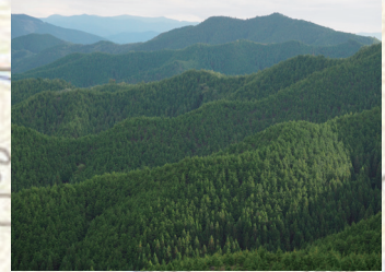
轆轤峠付近から紀伊山地を望む