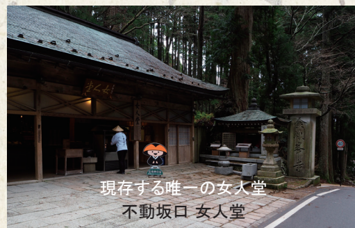
現存する唯一の女人堂 不動坂口 女人堂