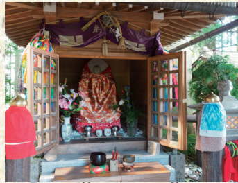
助けの地蔵(込の地蔵)